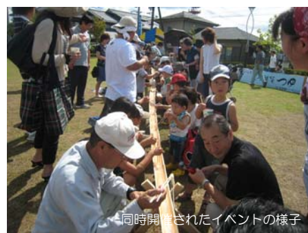
同時開催されたイベントの様子