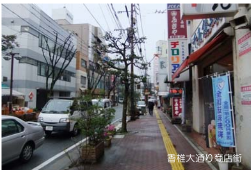
香椎大通り商店街