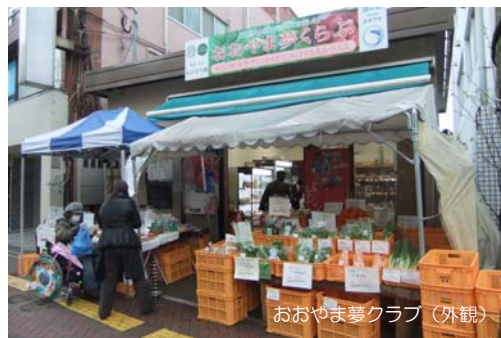
おおよま夢クラブ（外観）