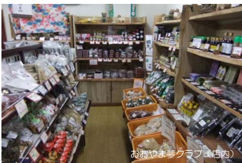
おおよま夢クラブ（店内）