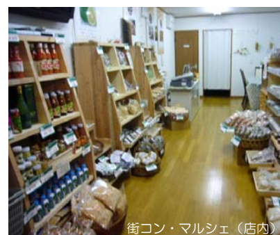
街コン・マルシェ（店内）