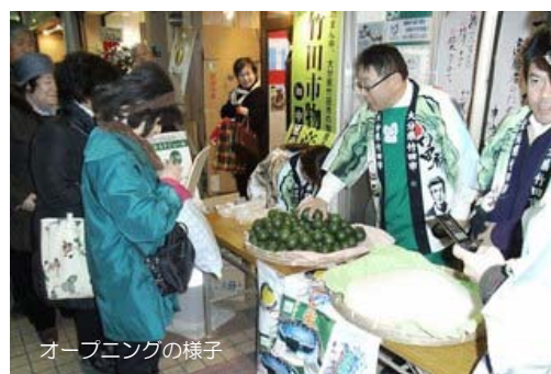
オープニングの様子