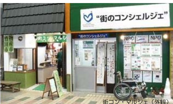
街コン・マルシェ（外観）