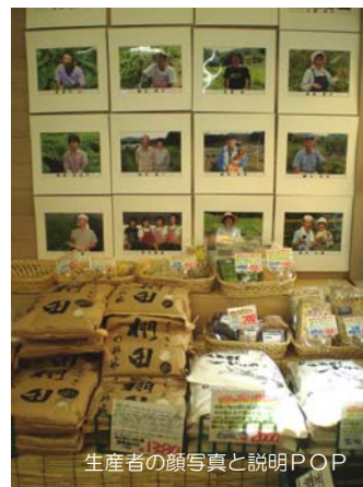
生産者の顔写真と説明POP