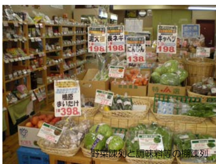
野菜陳列と調味料等の棚陳列