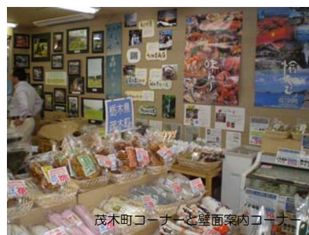
茂木町コーナーと壁面案内コーナー