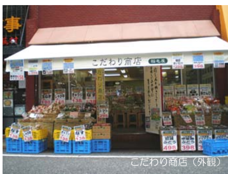
こだわり商店 (外観)