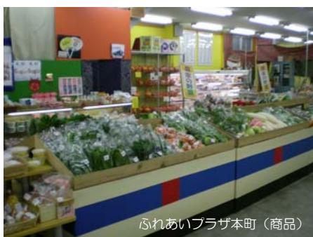
ふれあいプラザ本町（商品）