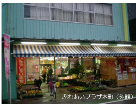
ふれあいプラザ本町（外観）