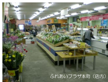
ふれあいプラザ本町（店内）